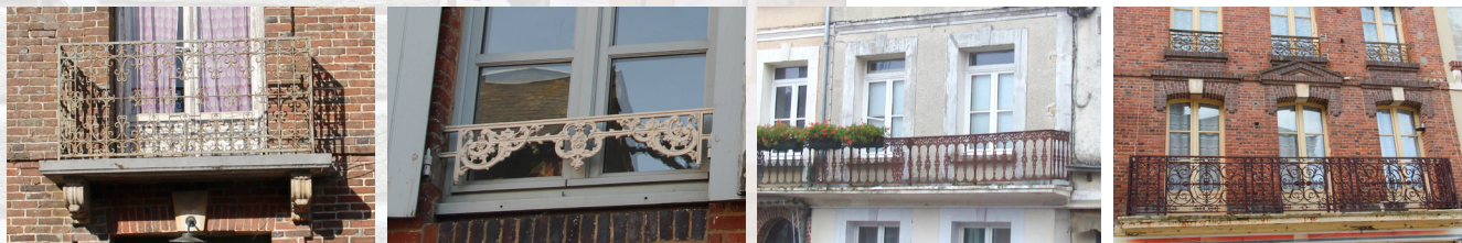
Balcons et appuis en fer moulé ou en fer forgé du XIX ème siècle.