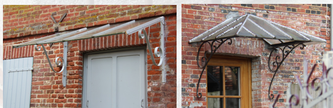
Marquises abritant les entrées.