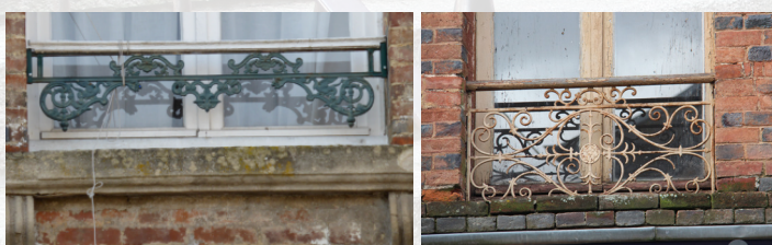
A la fin du XIX ème siècle, on trouve des mains courantes en bois sur un garde-corps en ferronnerie.