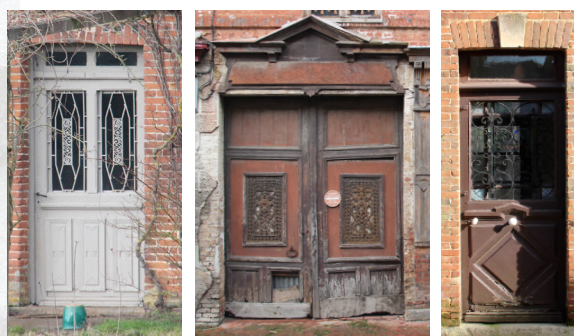
Grilles de portes.

En cas de suppression d'éléments en fer forgé , il est souhaitable de prendre contact avec la mairie de Sap-en-auge qui pourra estimer, le cas échéant, si la recupération des matériaux peut être envisagée .